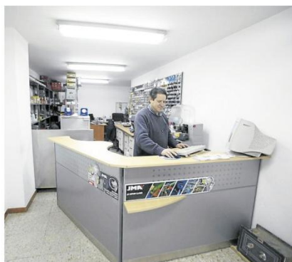
El equipo humano de la firma, todo profesionalidad.