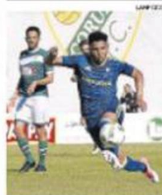
El Celta B fue superior en O Vao.

La música se ha puesto de moda en la hostelería viguesa, que oferta ya todos los fines de semana gran número de conciertos en la sesión vermouth o en horario nocturno. Se trata de una moda que va en aumento, en la que los hosteleros realizan un esfuerzo económico y los promotores y artistas ceden en beneficio de los clientes cada vez más exigentes. En la foto, un actuación de Met en la sesión vermouth del Patio de Bouzas. PÁG. 14