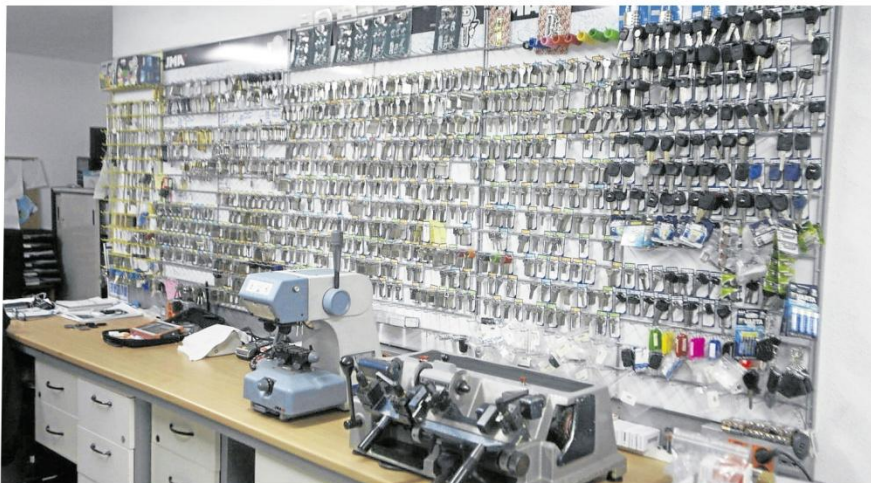
Ceseur ofrece servicios de cerrajería tradicional a la vanguardia de seguridad.

Ceseur Vigo es una de las empresas del sector de las cerrajerías y seguridad con más excelencia profesional. Una cerrajería en general con sat especializado en productos fichet cerraduras y todo tipo de cierres. Cuenta además con servicios de apertura de cajas fuertes de cualquier grado, especialistas en cajas fichet: venta cajas fuertes de grado y domésticas. Entre sus servicios se cuenta con un espacio para automatismos como puertas seccionales venta e instalación, así como puertas acorazadas homologadas para pisos ó chalets. Ceseur cuenta con un amplio equipo humano que ofrece, no solo la calidad de sus marcas y elementos, sino también un servicio de alta calidad que se adapta a las necesidades de los clientes y usuarios que buscan en esta empresa la perfección en equipamientos de seguridad en todos los sentidos. Ceseur es toda una marca de servicios de calidad en la ciudad.