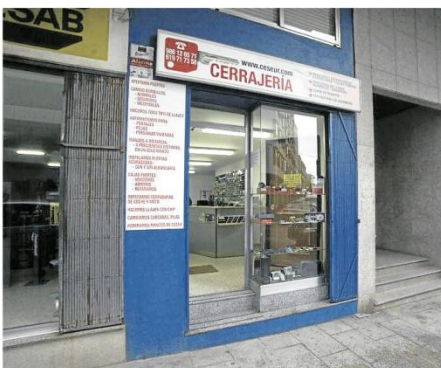
Sus marcas de calidad apuestan por un servicio perfecto.