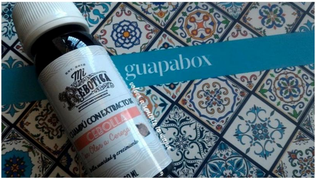
Champú con extracto de cebolla de Mi rebotica

Tiene un olor a cereza que me recuerda a los jarabes de cuando era pequeña y pronto lo comenzaré a usar: está libre de parabenos, colorantes y siliconas y promete dejar el cabello brillante y suelto.