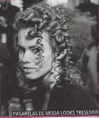
PASARELAS DE MODA LOOKS TRESemmé