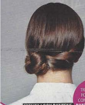
TRENZA LOOK PANTENE

TRATAMIENTO FORTIFICANTE CON PALTINIA DE PANTENE EXPERT, 14,99 €.