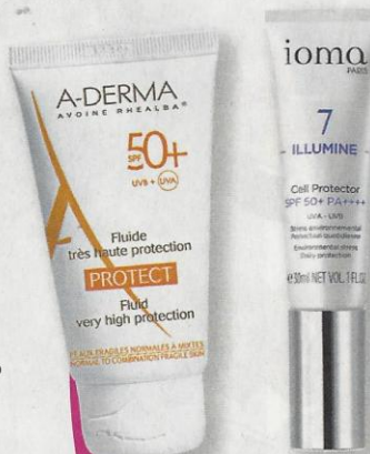
▲ Hidratante con SPF 50, de A-Derma: 14,11 €.

No olvides los cosméticos antiestrías para evitar que aparezcan en la medida de lo posible o para suavizarlas. En la última fase, la hinchazón sobre todo en las piernas y los pies hará que necesites aceites y cremas relajantes y refrescantes para aliviarla. ☘