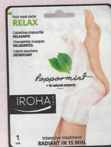
▼ Mascarilla relajante para pies, de Iroha Nature: 4,95 €.