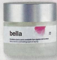
▶ Crema de día antimanchas, de Bella Aurora: 28,50 €.